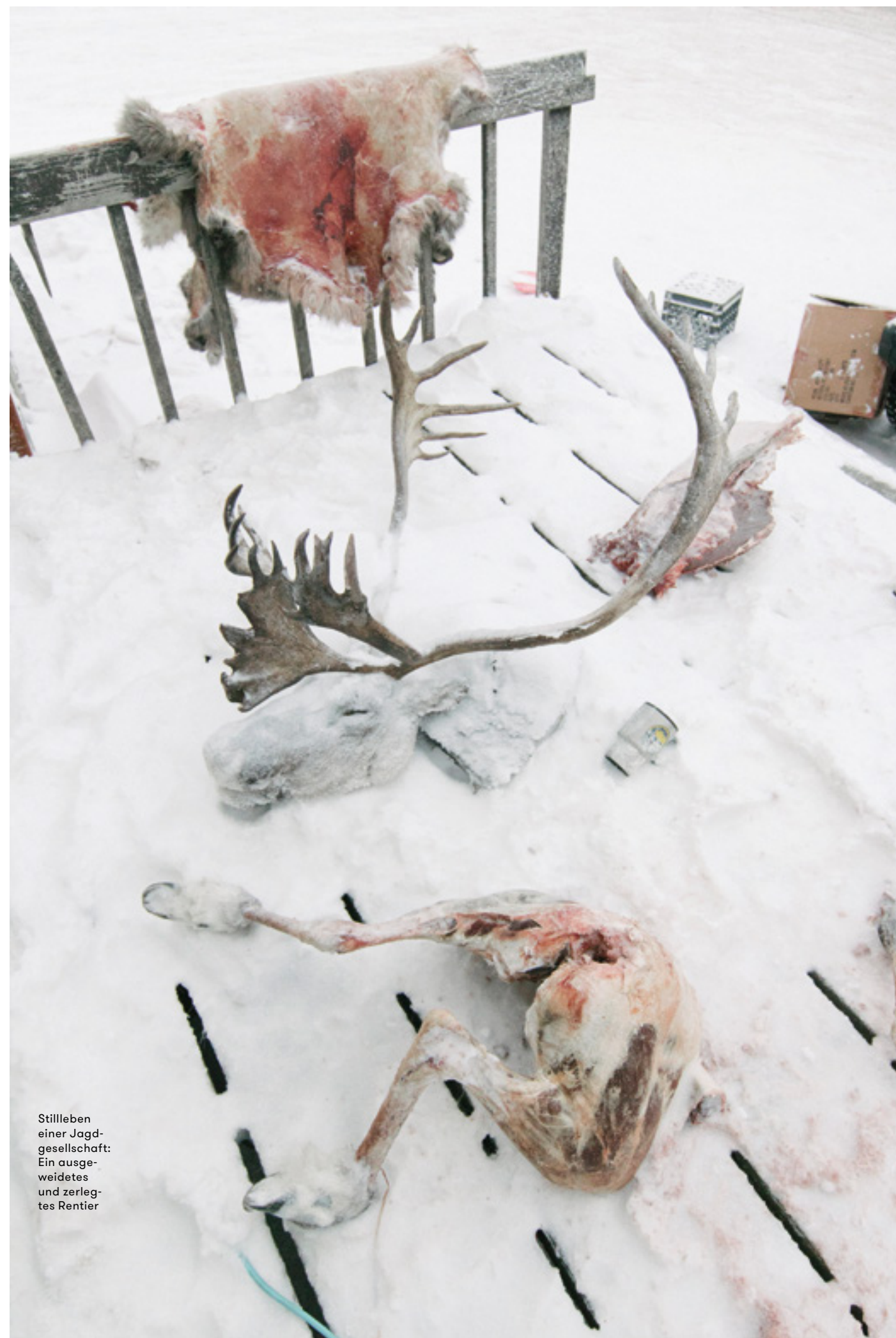
Stilleben einer Jagdgesellschaft: Ein ausgeweidetes und zerlegtes Rentier