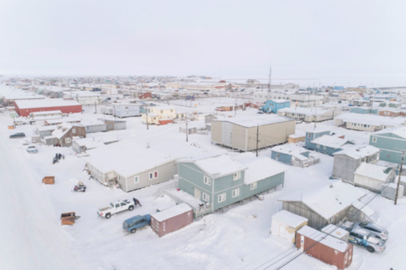
Stadt am «Wasserhimmel»: Utqiagvik, aufgenommen im Frühling, kurz vor der Schneeschmelze