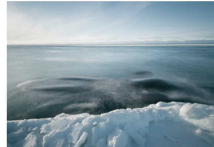
Der Wal zeigt sich: Für das indigene Volk der Inupiat eine göttliche Offenbarung